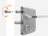
Serrure LAKD40 UZ