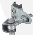
Bond quadridimensionnel GBMU4D16